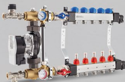
Rozdeľovače s prietokomerami a ovládacími ventilmi a zmiešavacou jednotkou s čerpadlom Wilo Para 25/6 - séria USFP