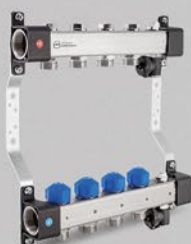
Rozdeľovače s regulačnými a ovládacími ventilmi a ventilačným úsekom - séria UVST