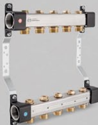
Rozdeľovače so 3/4" vsuvkami a uzatváracími ventilmi - séria RVV