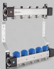
Rozdeľovače s regulačnými a ovládacími ventilmi - séria UVS