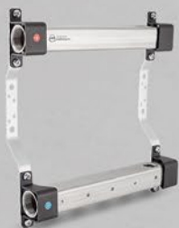
Rozdeľovače so 1/2" zásuvkami - séria RBB