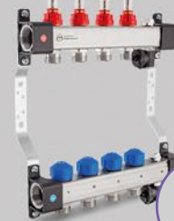
Rozdeľovače s prietokomerami 2,5 l/min alebo 5 l/min (max) a ovládacími ventilmi a ventilačným úsekom - séria UFST alebo UFST max