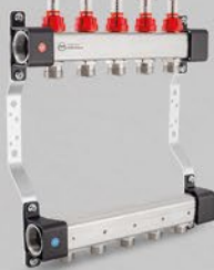
Rozdeľovače s prietokomerami - séria UFN