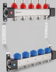
Rozdeľovače s prietokomerami a ovládacími ventilmi - séria UFS