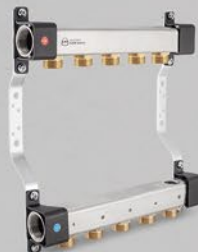
Rozdeľovače so 3/4" vsuvkami - séria RNN