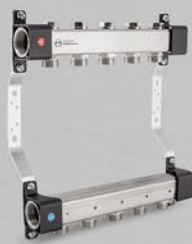
Rozdeľovače s regulačnými ventilmi - séria UVN